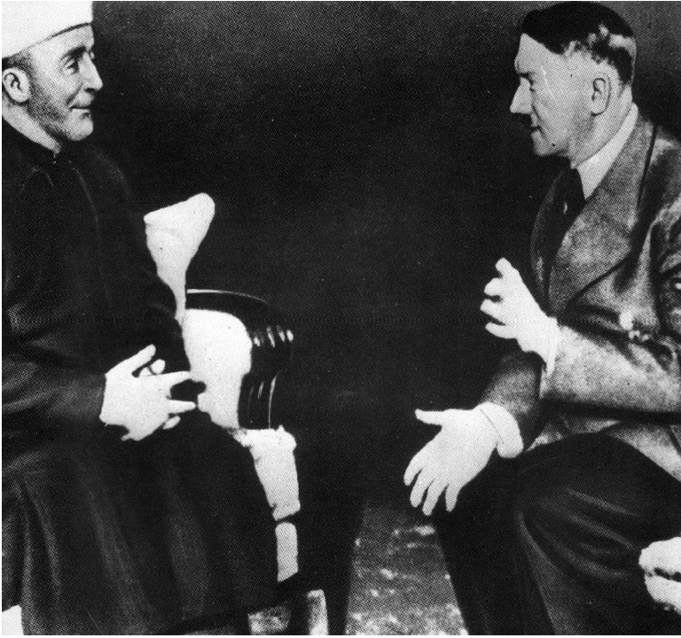
HAJJ AMIN AL-HUSSEINI Y HITLER EN 1941

Como líder de los árabes en Palestina durante la década de 1930, convocó a una jihād para aniquilar a los judíos de Palestina. En sus propias palabras: ¡Declaro una guerra santa, hermanos musulmanes! ¡Demost muerte a los judíos! ¡Matémoslos a todos! 8 Incitó además revueltas anti-judías, causando la muerte de cientos de personas en los asentamientos judíos, incluyendo las revueltas de Jerusalén en 1929 y de 1936 a 1939 9 , así como también la revuelta de Hebrón de 1929, en la cual toda la población judía de Hebrón fue masacrada. 10 Respaldó a Hitler desde sus comienzos y envió emisarios a Berlín en diciembre de